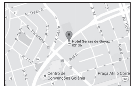
Localização do Hotel Serras de Goyaz

nas agências dos Correios. Você não pode faltar!